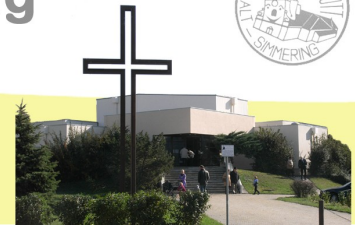
St. Josef auf der Haide